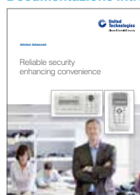
Brochure commerciale Advisor Advanced