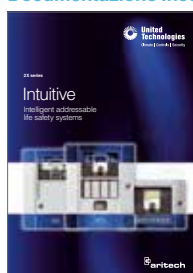
Brochure commerciale centrali 2X