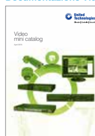
Mini catalogo Video