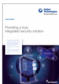
Brochure Advisor Master